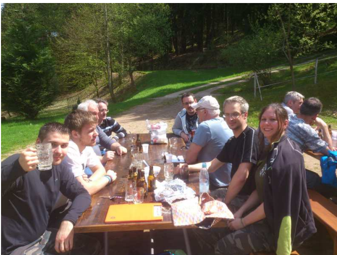
Prendre des forces, échanger les points de vue ....