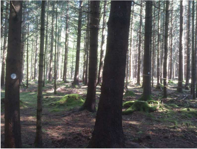
Au départ, pour la grande boucle, des points blancs à suivre ...