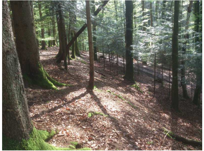
Dernière étape, la balise était dans cette laie parallèle au sentier.