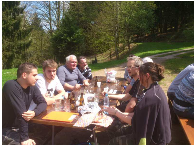
La convivialité d'après course,