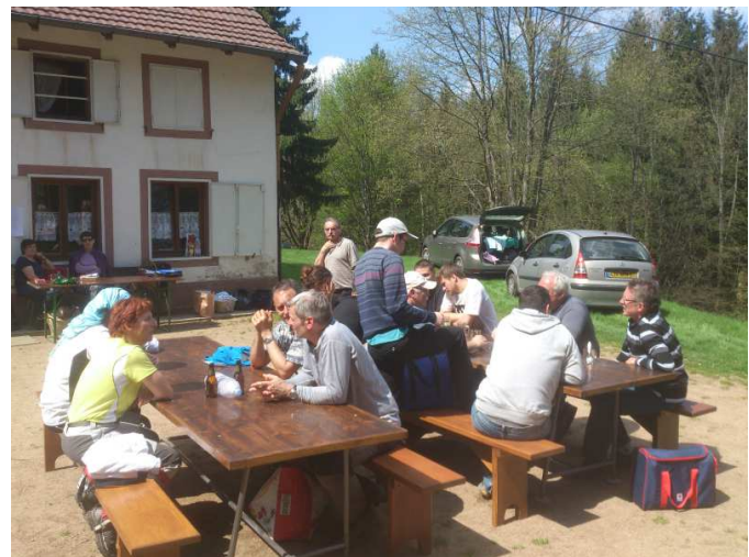
Dans l'attente des résultats !