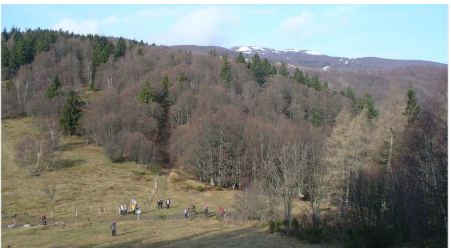
Le spectacle est magnifique