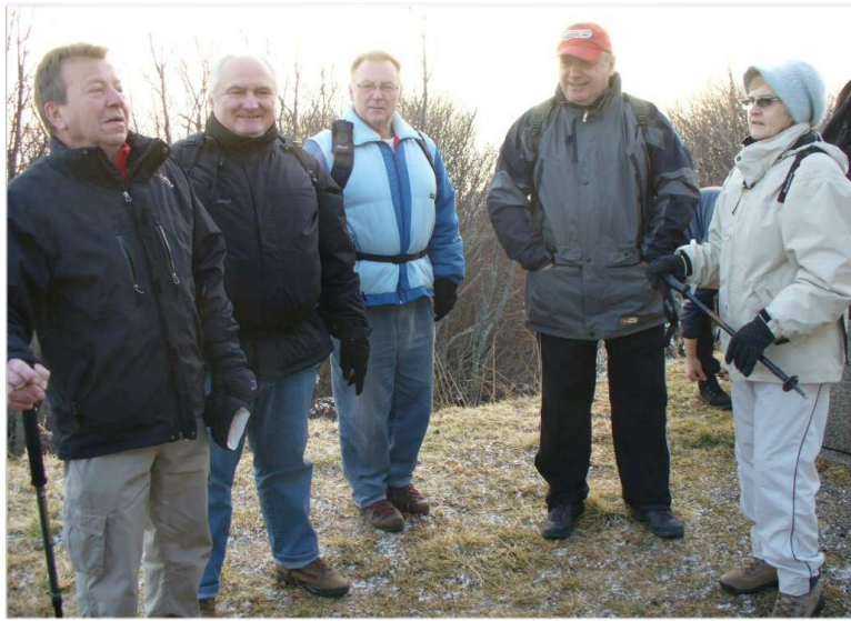
Départ du Grand Ballon