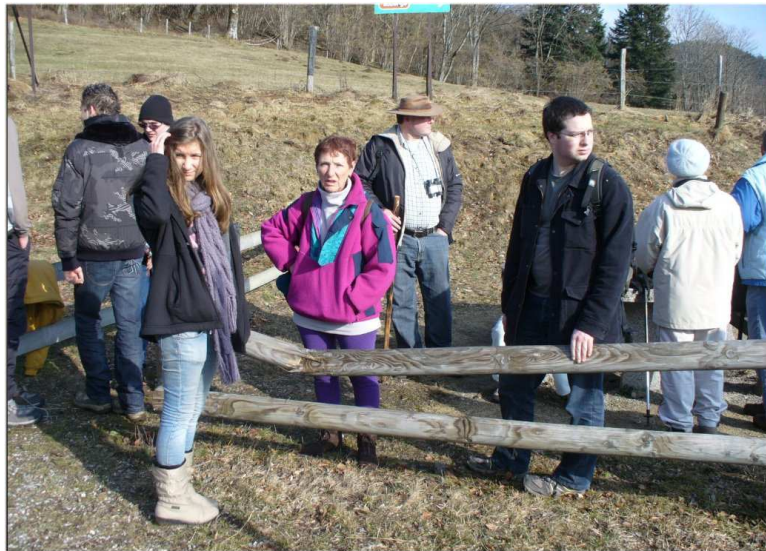
Halte au col Amic