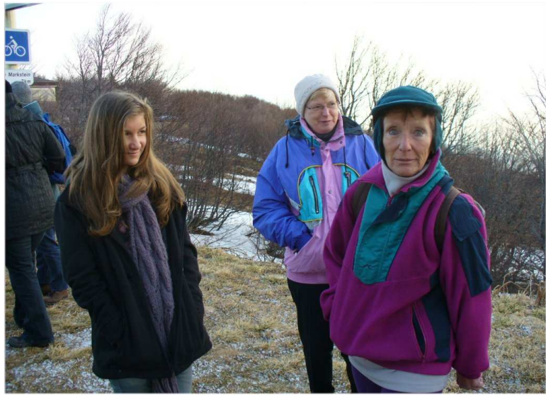
Les oreilles ont froid