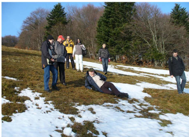
... et ça glisse quand même !!