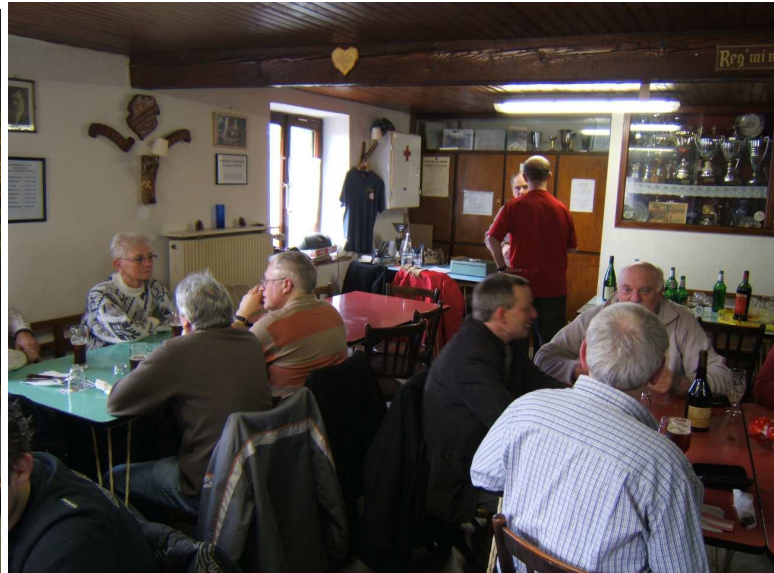
Et l'accueil, toujours chaleureux, au refuge de l'UTLA Mulhouse. Merci à eux.