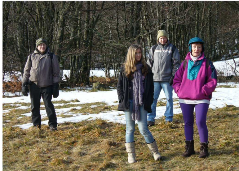
Il reste de la neige