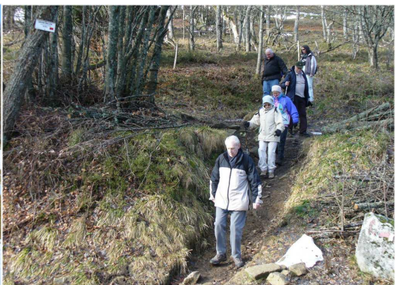
Heureusement, il y a des chemins.